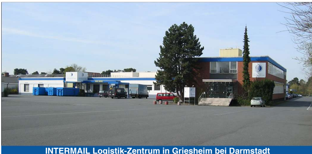
INTERMAIL Logistik-Zentrum in Griesheim bei Darmstadt

Sehr geehrte Geschäftspartner, sehr geehrte Kunden!